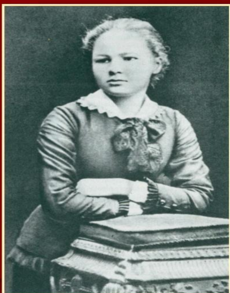
Maria Skłodowska w wieku 16 lat

Jestem z tych, którzy wierzą, że Nauką jest czymś bardzo pięknym.